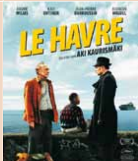
Drama DE/FR/FI 2011 Regie u. Buch: Aki Kaurismäki mit André Wilms ab 12 Jahren 103 Min.

Der 60-jährige Marcel Marx war einst Schriftsteller und gehörte den Kreisen der Intellektuellen an. Da der gewünschte Autorenerfolg jedoch niemals eintrat, zog er in die Hafenstadt Le Havre. Dort übt er seit jeher den wenig profitablen, aber dennoch ehrbaren Beruf des Schuhputzers aus. Marcel ist glücklich und zufrieden mit seinem einfachen Leben, seiner Frau Arletty und seinen Freunden. Doch dann erkrankt Arletty an Krebs. Während sie im Krankenhaus liegt, bietet er einem afrikanischen Flüchtlingskind namens Idrissa Unterschlupf in seinem Haus. Derweil ist Kommissar Monet dem Jungen auf den Fersen. Obgleich Marcel bei Bäckerin, Gemüsehändler und Barbesitzerin tief in der Kreide steht, helfen sie ihm, Idrissa vor den Behörden zu verstecken und ihn auf ein Schiff zu dessen Mutter nach England zu schummeln.