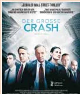
Thriller USA 2011 Regie und Buch: J.C. Chandor mit Jeremy Irons, Demi Moore ab 6 Jahren 109 Min.

Wall Street 2008: Vermögensberater, Broker und Börsenmakler jonglieren noch ohne schlechtes Gewissen mit hohen Einsätzen und erzielen schwindelerregende Gewinnmargen. Doch die Finanzkrise hat bereits Einzug gehalten. Wie viele andere Kollegen wird auch Eric Dale, Top-Risk-Analyst in einer großen Investmentfirma, kurzfristig entlassen. Dale arbeitete an einer Analyse der aktuellen Unternehmenssituation und übergibt die brisanten Daten bei seiner Entlassung seinem ehemaligen Schützling, dem smarten Jungtalent Peter Sullivan. Sullivan stellt daraufhin weitere Berechnungen an und erkennt, dass der finanzielle Untergang seiner Firma bevorsteht. Gemeinsam entwickeln die führenden Köpfe der Firma einen Plan, der für den weltweiten Finanzmarkt verheerende Folgen haben wird.