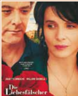
Drama FR/IT/BE 2010 Regie und Buch: Abbas Kiarostami mit Juliette Binoche ohne Altersb., 106 Min.

Während einer Lesereise in Italien stellt der britische Autor James Miller sein neuestes Buch vor, ein kunsthistorisch-philosophisches Werk über die Bewertung und den Stellenwert von Kopien, und weckt das Interesse der französischen Antiquitätenhändlerin Elle. Die beiden beschließen am nächsten Tag, einen Ausflug in ein pittoreskes Bergdorf im Süden der Toskana zu machen. Schon während der Fahrt knistert es zwischen ihnen, sie sprechen über die Kunst, das Leben und die Liebe und geben sich für ein seit 15 Jahren verheiratetes Paar aus. Immer wieder stellt sich die Frage nach Wahrheit und Wahrnehmung, Täuschung und Lüge, Original und Fälschung. Spielen sie oder sind sie ein Paar, artikulieren sie nur eigene Ängste oder suchen sie eine Erklärung für ihr Scheitern?