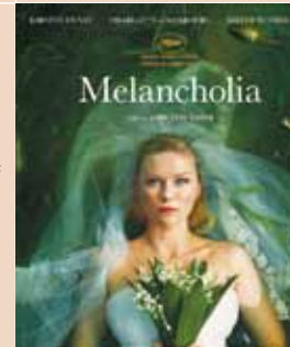
Sci-Fi/Drama FR/DK/SE/DE 2011 Regie: Lars von Trier mit Kirsten Dunst, Kiefer Sutherland ab 12 Jahren 130 Min.