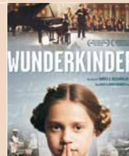
Drama Deutschland 2011 Regie: Markus Rosenmüller mit Gudrun Landgrebe, Kai Wiesinger, Konstantin Wecker ab 12 Jahren, 100 Min.

In Poltava, Ukraine, lernen sich 1941 die Kinder Hanna, Larissa und Abrascha kennen. Der hochbegabte Violinist Abrascha und die nicht minder begabte Pianistin Larissa werden als Wunderkinder der klassischen Musik gefeiert. Sie spielen in den großen Konzertsälen Russlands, vor der Parteilite und sogar vor Stalin. Hanna, Tochter des deutschen Brauers Max Reich und seiner Frau Helga, ist selbst eine talentierte Geigerin und wünscht sich nichts sehnlicher, als Unterricht mit den russischen Wunderkindern zu bekommen, die zunächst verhalten reagieren. Erst als ihre Lehrerin Irina Salmonova einwilligt, auch Hanna zu unterrichten, entwickelt sich zwischen den Kindern eine innige Freundschaft, die durch den Angriff der Deutschen auf Russland auf eine harte Probe gestellt wird.