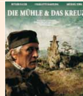
Drama Schweden/Polen 2011 Regie und Buch: Lech Majewski ab 12 Jahren 92 Min.