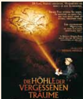
Dokumentation FR/US/UK/CA/DE 2010 Kinostart DE: 03.11.2011 Regie: Werner Herzog 90 Min. ab 6 Jahren

Dokumentation über die Chauvet-Höhlen, wo 1994 sensationelle historische Funde gemacht wurden: Nahe der französischen Kleinstadt Vallon-Pont-d'Arc im Department Ardèche entdeckten Wissenschaftler rund 400 Wandbilder mit gravierten Tier- und Symboldarstellungen. Das Alter dieser Malereien wurde auf 33.000 bis 30.000 vor Christus datiert. Um diese zu schützen, wurde die Fundstelle bald wieder „versiegelt“ und der breiten Öffentlichkeit der Zugang verwehrt. Dass man dennoch einen Blick in diese geheimnisvolle Vergangenheit werfen kann, ist dem von der Höhlenmalerei faszinierten Filmemacher Werner Herzog zu verdanken. Mit einem Miniteam drang er in das unterirdische Reich vor und filmte seine Expedition. Allerdings benötigte es große Überredungskunst, um von den Behörden die Erlaubnis zum Drehen zu bekommen.