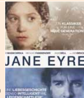
Drama/Literaturverfilmung Großbritannien 2011 Regie: Cary Fukunaga mit Jamie Bell ab 12 Jahren 120 Min.