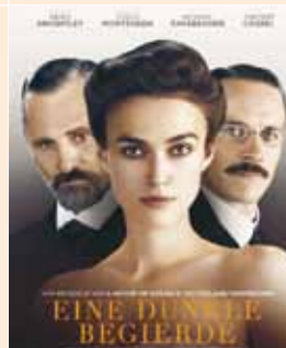
Drama/Thriller UK/DE/CA/CH 2011 Regie: David Cronenberg mit Keira Knightley ab 16 Jahren 100 Min.