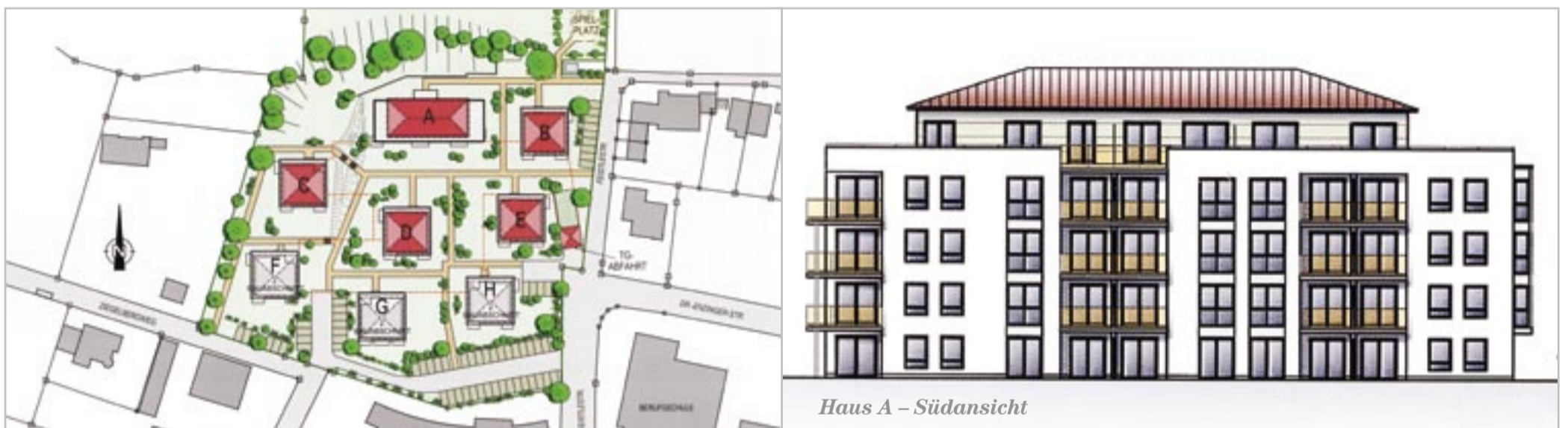
Haus A – Südansicht