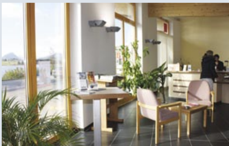
Sorgte in den letzten Wochen oft für Gesprächsstoff: der neue Pavillon der Tourist Information in Hopfen am See. Wenn die letzten Nachbesserungen vollzogen sind, ist das Gebäude an der Uferstraße vollkommen barrierefrei.

Hopfen am See. Der neue Pavillon der Tourist Information in Hopfen am See sorgte in den letzten Wochen immer wieder für Gesprächsstoff. Die fehlende Barrierefreiheit dieses neuen Gebäudes an der Uferstraße war dabei fast immer ein