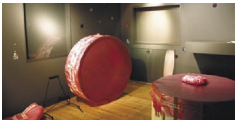
Die erfolgreiche Landesaussstellung hat das Feld geräumt...