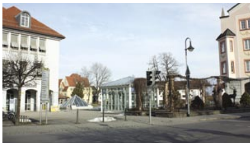
Auf der freien Fläche am Kaiser-Maximilian-Platz soll nun bald das neue Einkaufszentrum „Theresienhof“ entstehen.

Der Theresienhof würde zudem die umfangreichen städtebaulichen Maßnahmen im Bereich König-Ludwig-Promenade und Theresienstraße hin zur Sebastianstraße abrunden. „Wenn es jetzt nun hier noch gelingt, mit dem Theresienhof den letzten Knopf zu schließen, dann haben wir hier einiges an Aufwertung und Steigerung der Lebensqualität erreicht“, erläutert Stadtbau-