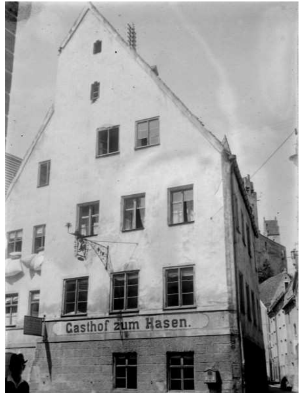
um 1900