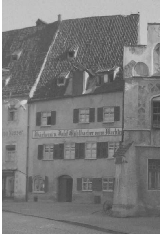
um 1910