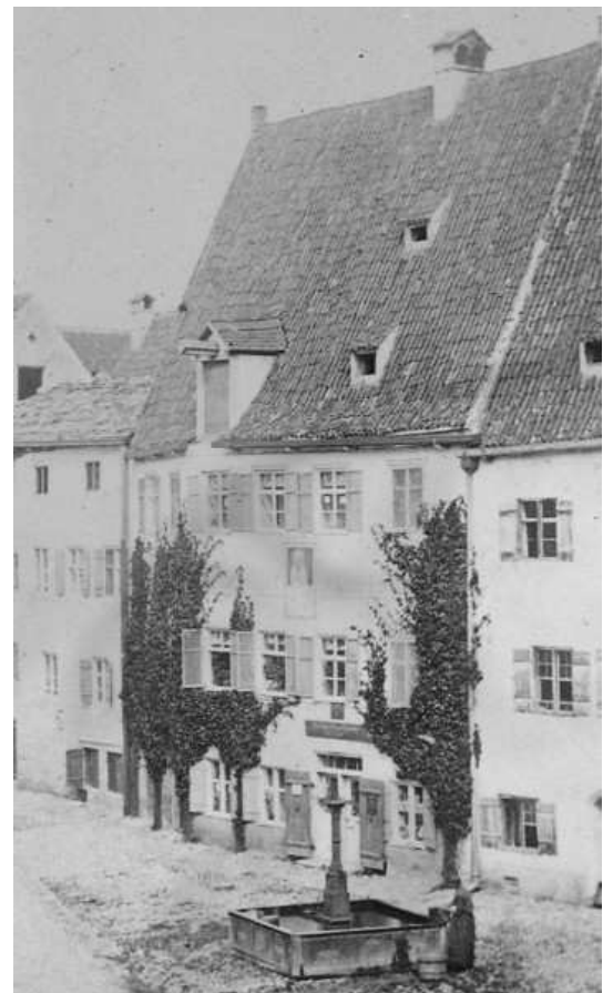
vor 1900