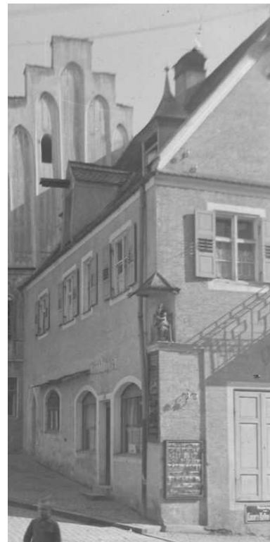
um 1910