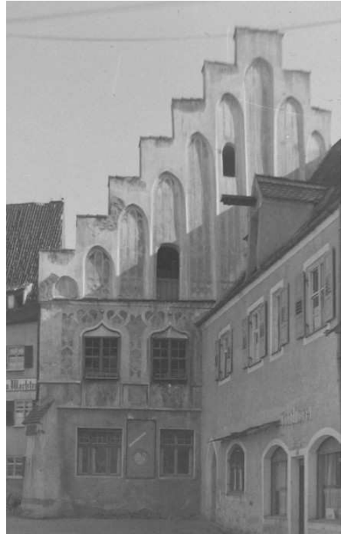
um 1910