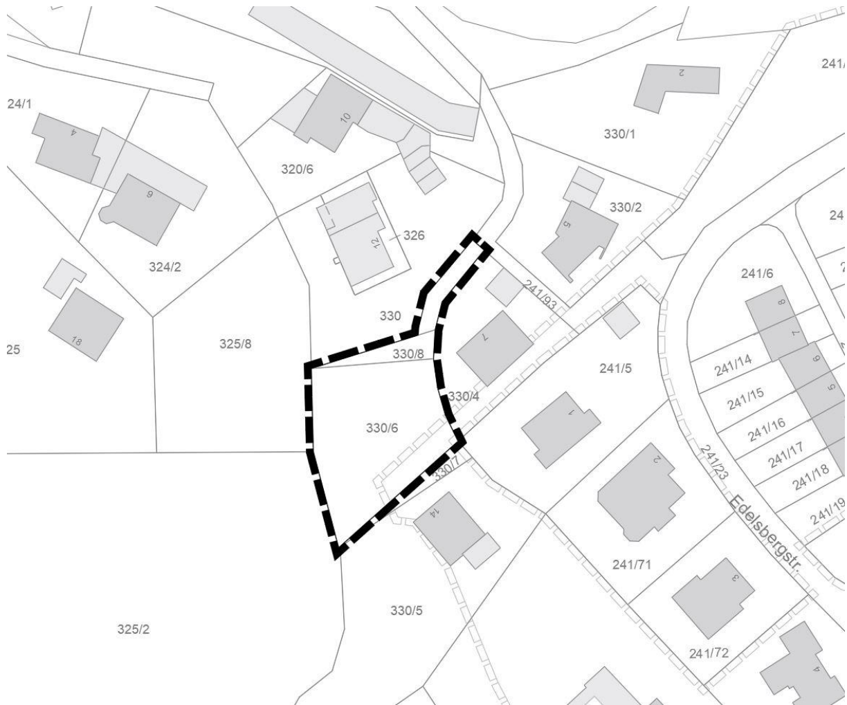
Lageplan mit Geltungsbereich, ohne Maßstab

Der Stadtrat der Stadt Füssen beschloss am 03.03.2020 in öffentlicher Sitzung die Aufstellung des Bebauungsplans Weißensee – See, vierte Änderung. Der Stadtrat der Stadt Füssen beschloss die Billigung des Vorentwurfs in der Fassung vom 03.03.2020 und beauftragte die Verwaltung mit den weiteren Schritten zur Durchführung der frühzeitigen Beteiligung der Öffentlichkeit, der Behörden und sonstigen Träger öffentlicher Belange. Der räumliche Geltungsbereich ist dem nachstehenden Lageplan zu entnehmen.